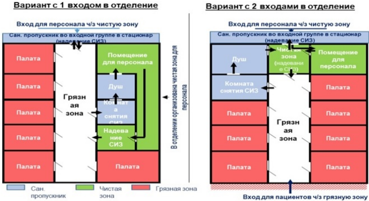
Схема модульного инфекционного стационара